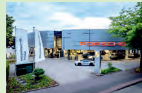
PORSCHE ZENTRUM OLDENBURG